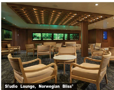
Studio Lounge, Norwegian Bliss®