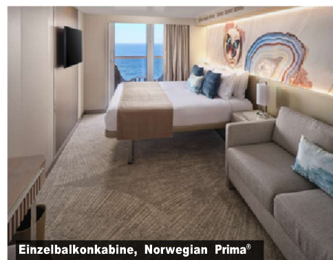
Einzelbalkonkabine, Norwegian Prima®

FÜR MEHR INFORMATIONEN UND UNSERE WELTWEITE ROUTENVIELFALT BESUCHEN SIE NCL.COM ODER KONTAKTIEREN SIE IHR REISEBÜRO